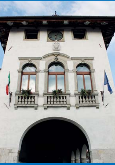
1 Antico Palazzo Comunale (XV sec.) Loggia, Biblioteca Guameriana.