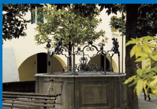
5 Piazza Cattaneo, fontana cinquecentesca.