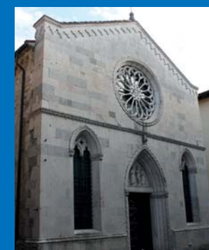
7 Chiesa di Sant'Antonio Abate (XIV sec.).