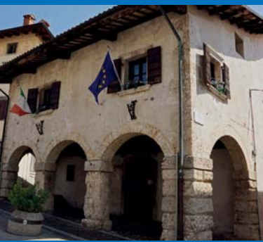
2 Casa del Trecento.