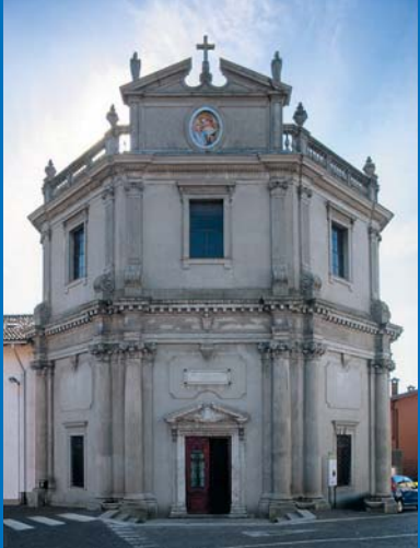
10 Santuario di Madonna di Strada (XVII sec.).