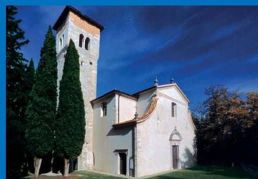
4 Parco del Castello, Chiesa di San Daniele in Castello (XVIII sec.).