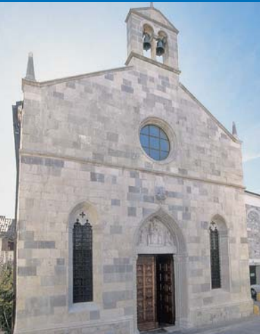
3 Chiesa di Santa Maria della Fratta (XIV sec.).