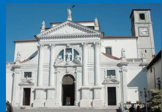
8 Duomo di San Michele Arcangelo (XVIII sec.).