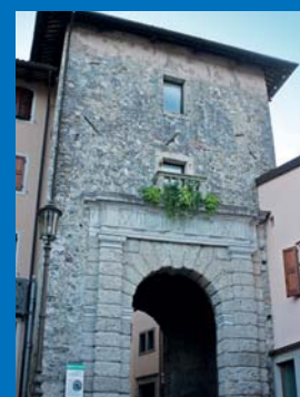
6 Portonat (XVI sec.).