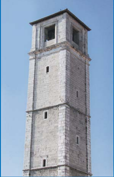
9 Campanile (XVI sec.).